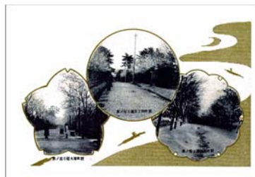
左と上 新町住宅地分譲初期の 絵葉書の復刻版