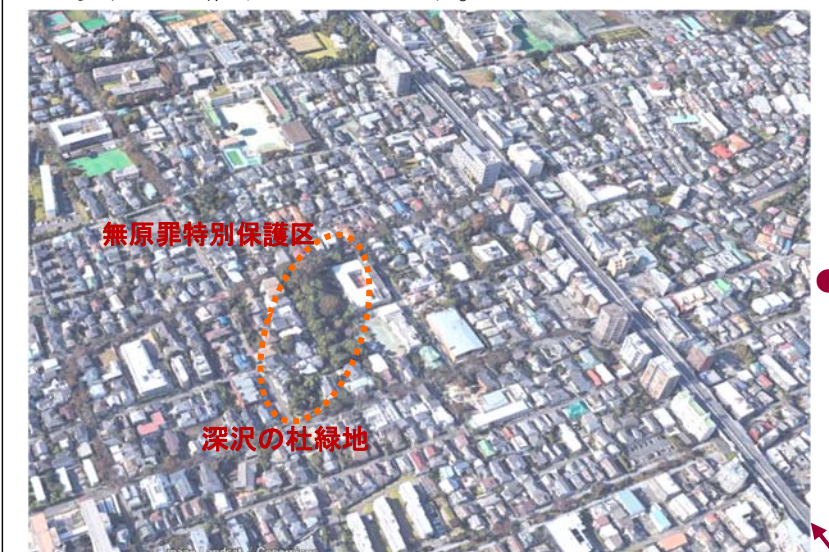
③ 2018年6月の航空写真(Google Earthによる)

①の図の○で囲んだ二つのみどりは、②の写真の樹木地に継承され、①の左のみどりと池は、②を経て③の現在まで継承されています。