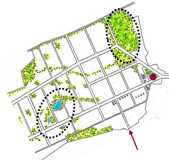
① 分譲対象地の図(左部分を除く)に着色 実際と異なった位置の道路も載っています。 新町住宅地の販売パンフレットより