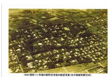
右と上 1面掲載の②の航空写真 と2018年の航空写真